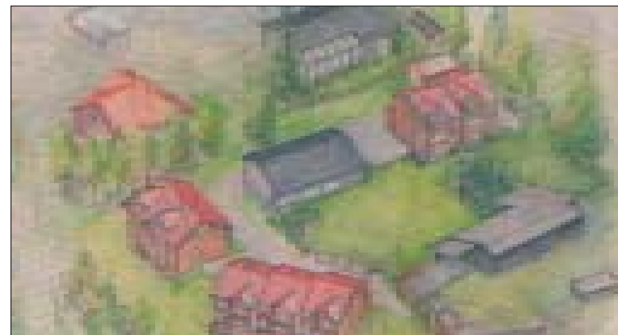
Lavblokkene til venstre ville ikke blitt godkjent i dag. Småhusene over passer ikke inn i strøket mener kommunen. Alle utklippene er hentet fra Aftenposten Aften 20.08.2004

Ifølge Ullern Avis Akersposten 2. juni vandret bydelspolitikere rundt i Vinderenområdet for å se på tomter hvor ”utbyggingen kanskje kunne vært løst på en annen måte, for å si det mildt”. Kan ikke politikere og reguleringsmyndigheter lære av gamle dumheter?