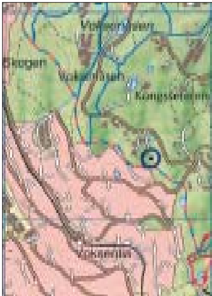
Kikutkartet, målestokk 1:25 000, Statens kartverk.