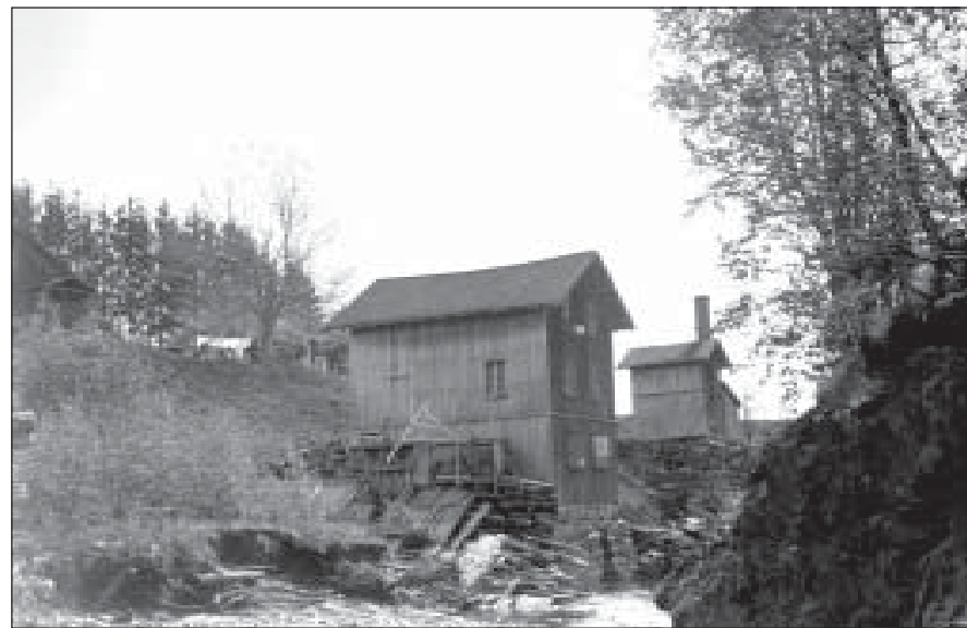
Nederst: Voksen mølle. Fotografert 1939 av Niels Fr. Woxen