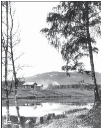
Blåsbort ved Holmendammen.

Backersvingen i Holmenkollveien like ovenfor Gressbanen var bråere før. De akende visste at hvis de skulle beholde gli og fart over Holmensletta, gjaldt det å ha fart i svingen. Gle man over sletta med ”Blåsbort” på venstre side, gikk det i ett videre til Skøyen. Dette fortalte mine foreldre som akte her en del omkring 1914.