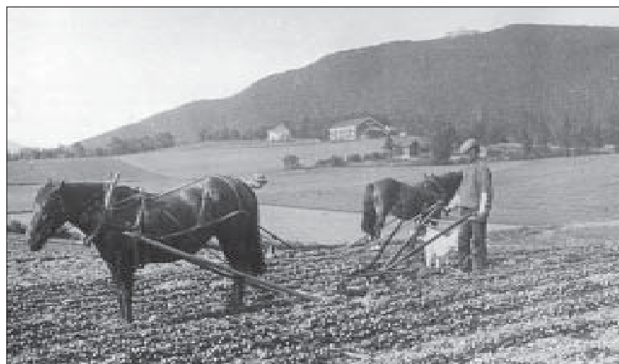
Voksenjordene rundt 1910.