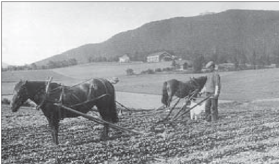
Voksenjordene rundt 1910.