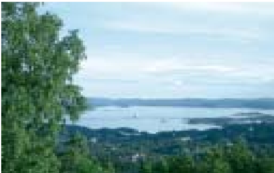
Over: Utsikten fra plenen foran Brattalid. Under: Vettali i dag. Samme utsikt herfra?