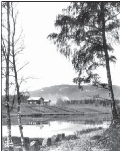
Blåsbort ved Holmendammen.

Backersvingen i Holmenkollveien like ovenfor Gressbanen var bråere før. De akende visste at hvis de skulle beholde gli og fart over Holmensletta, gjaldt det å ha fart i svingen. Gle man over sletta med ”Blåsbort” på venstre side, gikk det i ett videre til Skøyen. Dette fortalte mine foreldre som akte her en del omkring 1914.