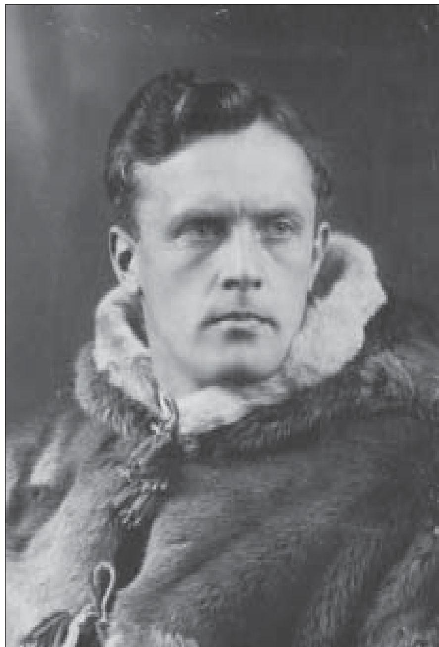
Pelsjegeren. Hentet fra Pelsjegerliv blant Nord-Canadas indianere.