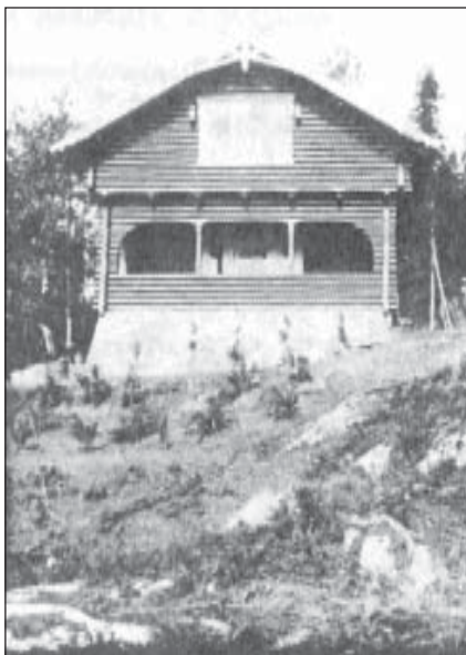
Vettali – et naturlig navn på det første og øverste huset i lia mot Vettakollen.

Artikkelen sto i medlemsblad nr. 2/1994.