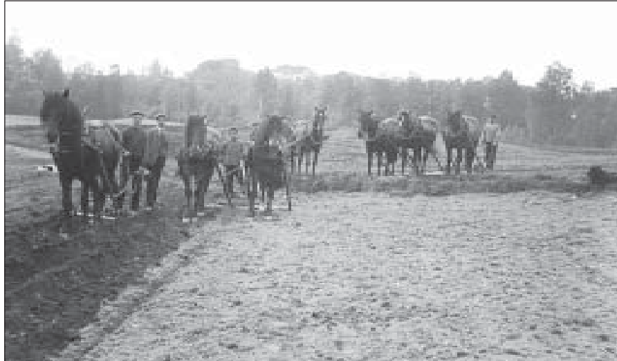
Vårarbeid før traktoren ble tatt i bruk. Foto rundt 1910.