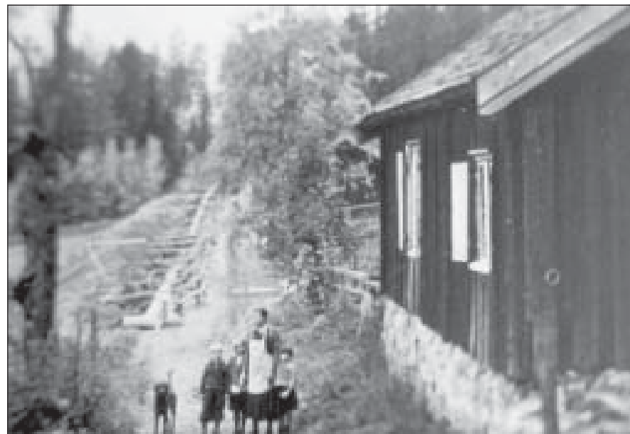
Øverst: Søndre Jarbakken. Husmannsfamilien står på Ankerveien.