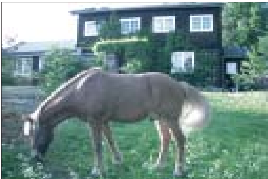
Over: Forsiden av Ingstads hus med kontortilbygget til venstre. Under: Fremdeles er det grønlandshunder i huset.