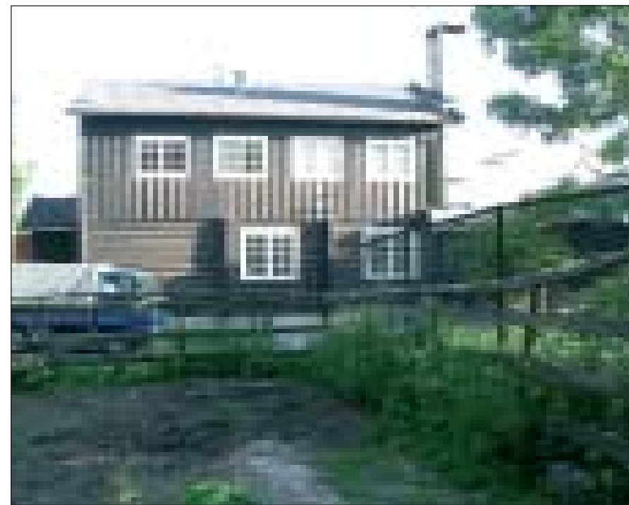
Kjernen i Helge Ingstads hus med de originale tømmervegger i første etasje.

Helge Ingstad elsket å bo her. Han hadde sine jevnlige turer til Fuglemyra på toppen av Vettakollen, hvor han tok sin morgengymnastikk. Sammen med sin kjære kone Anne Stine hadde han her et levende miljø med kunstnere og forfattere i det vakre hjemmet. De satte begge stor pris på naturen rundt, og ikke minst den fredelige atmosfæren som preget stedet Brattalid.