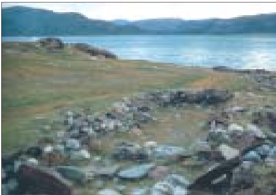
Brattalid, Eirik Raudes gård på Grønland. Aschehougs norgeshistorie, bind 2.