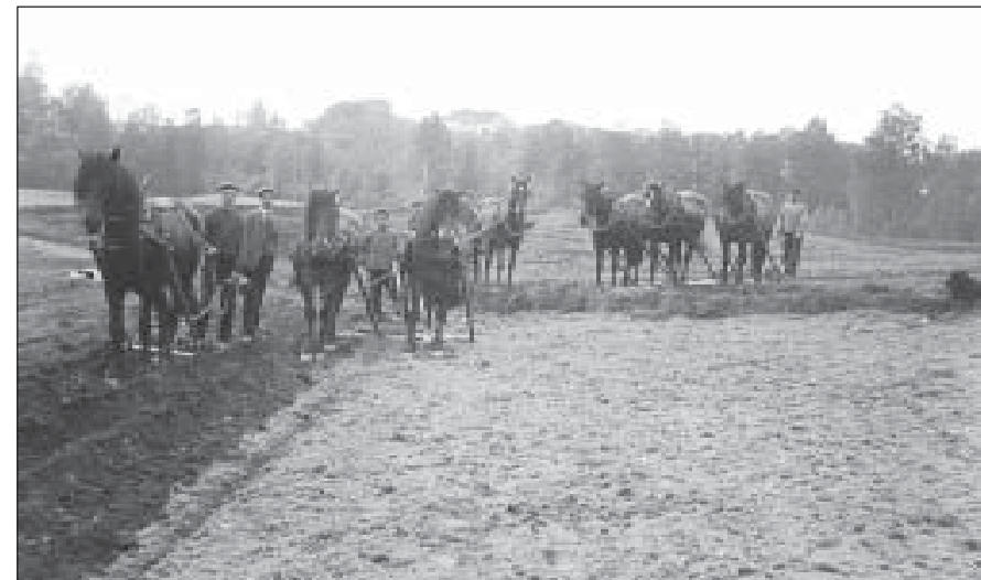
Vårarbeid før traktoren ble tatt i bruk. Foto rundt 1910.