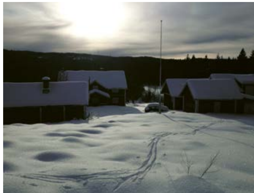
Lørensæter en søndag i februar 2013. Bilen på tunet har gått i vinterdvale!