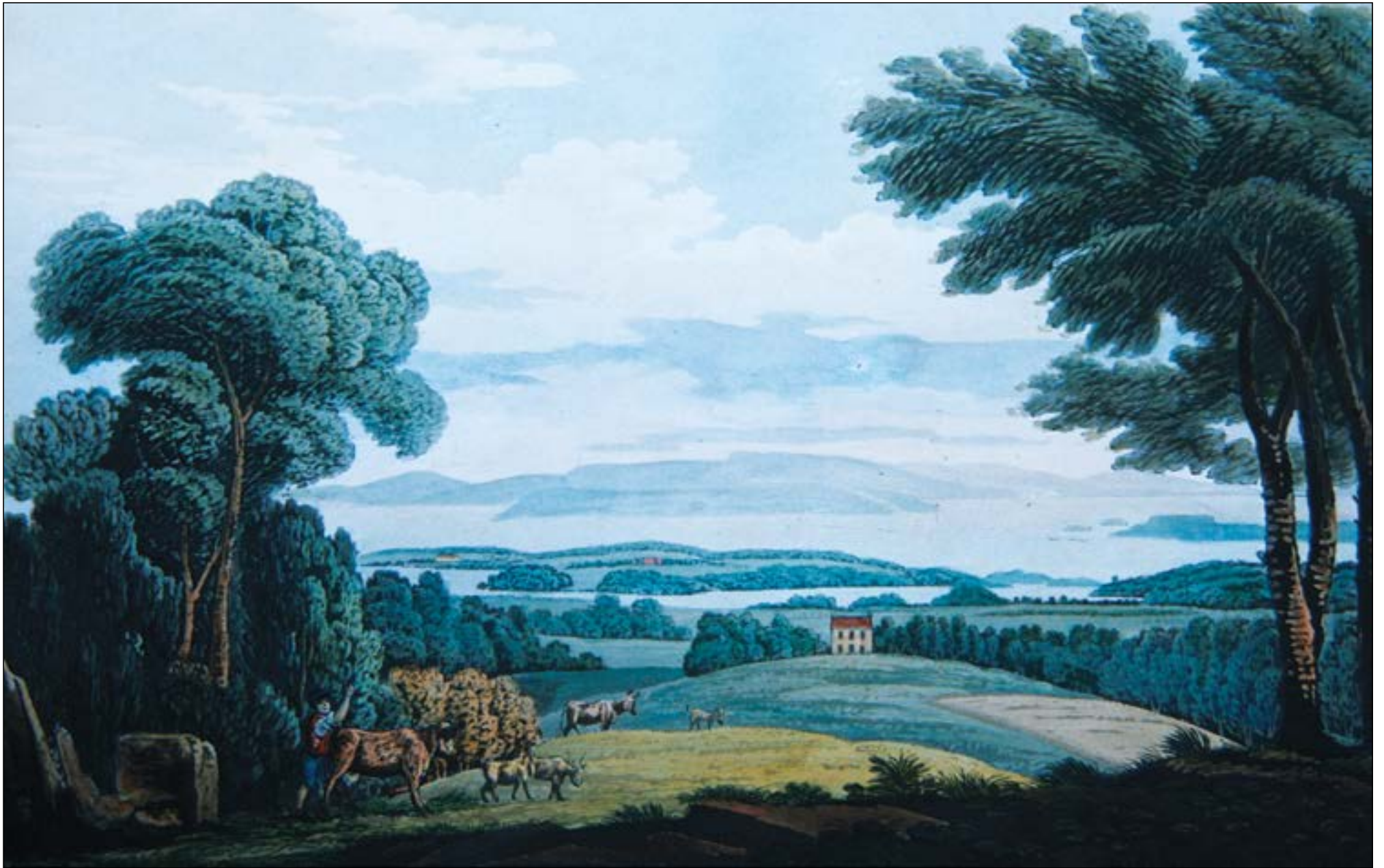
Holmen gård ca. 1850. Håndkolert trykk av Anita Nyegaard. Vi ser rett mot Bygdøy, Nesodlandet og Oslofjorden. Gjetergutten sees til venstre i forgrunnen.