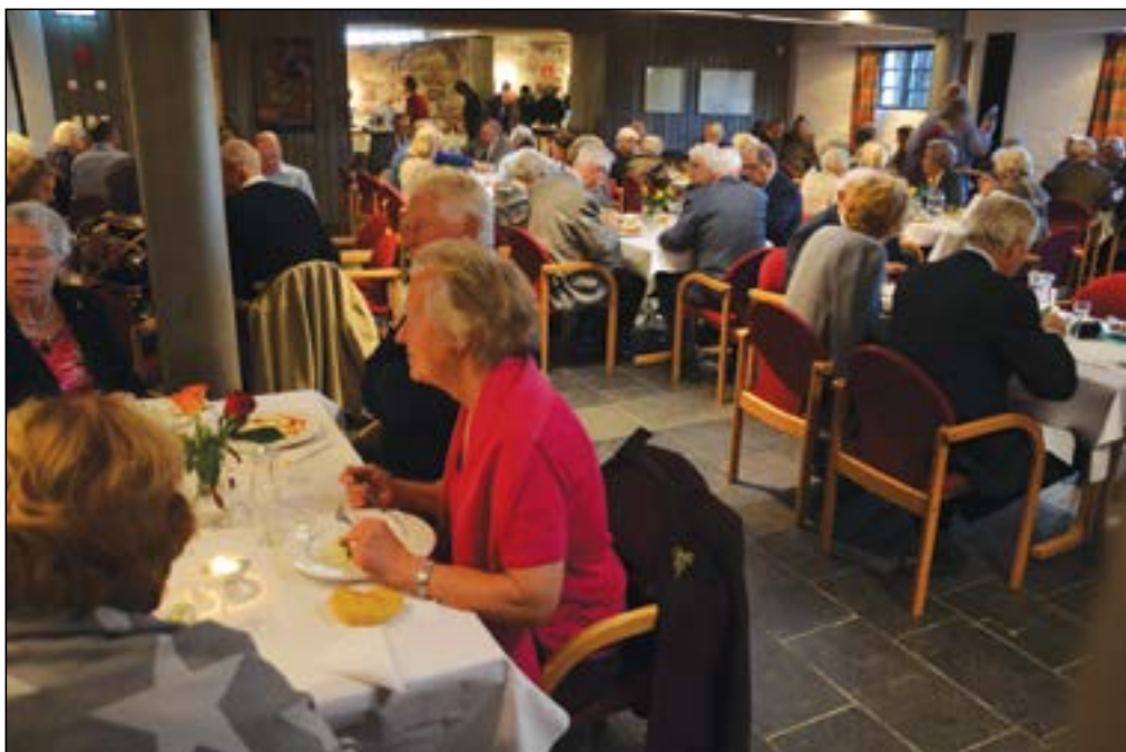
Nesten 150 personer var med på middagen i Holmenkollen kapell for å gjøre stas på jubilanten.