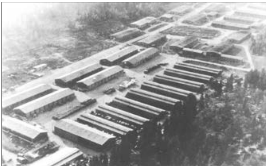
Lager Nordstrand på Lambertseter - en av de største leirene i Oslo med lemmebrakker på geledd. Leiren var også transittleir for hester brukt til flytting av tysk artilleri. Hestene sto i brakkene med høyere tak.

på fabrikken. De ble gjenoppført i Maridalsveien, der Gets kontorbygg nå ligger.