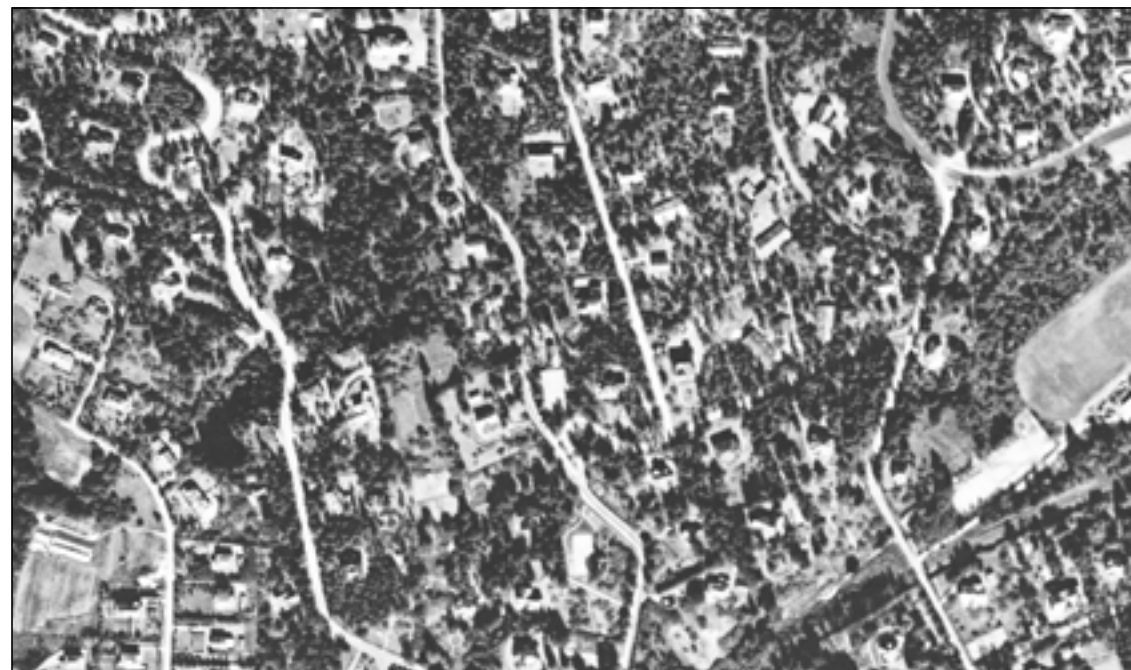
Flyfoto fra 1947 av det aktuelle område. De lodrette veiene er fra venstre Frognerseterveien, Skogryggveien og Skådalsveien. I midten nederst, den krokete Faunveien.