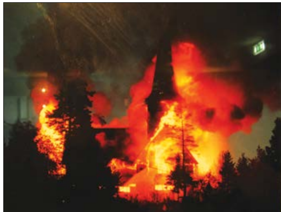
En augustnatt i 1992 ble kapellet tent på, og det brant ned til grunnen. Den 15 år gamle trebygningen som står der i dag, er faktisk mer identisk med de opprinnelige arkitekttegningene enn det gamle kapellet som brant.

Allerede ved seks-tiden raste kapellet sammen. Ødeleggelsen var nesten total. Det eneste som sto tilbake noenlunde intakt var grunnmuren, de to trappene som førte inn til kirken fra vest og smijernsrekkverkene på trappene. Døren til sakristiet sto åpen da brannmannskapene kom til stedet. ”Det kan tyde på innbrudd og bran-