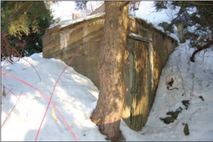
Bunker i Skogryggveien 1. står strategisk i hagen ved krysset mellom Frognerse- terveien-Faunveien for å beskytte de tyske offiserene i villaene lenger oppe.