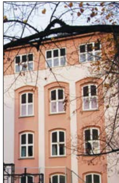
Flykttunnelen fra Oslo Handelsgymnasium endte her på Ruseløkka skole

Bjørnveien 3 Dagaliveien 8 (Tysk sikkerhetspoliti), 12, 30 Dronningveien (Skådalsveien) 2, 4 Ekorneveien 3 (Einsatzstab Wegener) Fossheim hotell