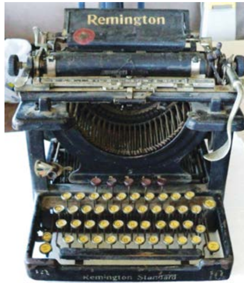
Det er ikke så mange år siden denne maskinen stod i de tusen hjem. Remington var ledende på å produsere skrivemaskiner fra slutten av 1800-tallet både i USA og Norge.